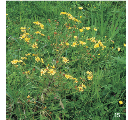
Abspreizendes Kreuzkraut ( Senecio erraticus )

Verwechslungsmöglichkeit mit weiteren Senecio-Arten, die aber ebenfalls giftig sind, ist unter anderem Abspreizendes Kreuzkraut ( Senecio erraticus ).