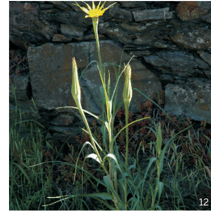
Wiesen-Bocksbart ( Tragopogon pratensis )