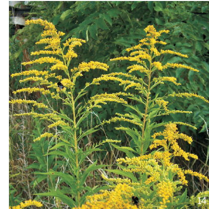
Kanadische Goldrute ( Solidago canadensis )