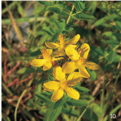
Johanniskraut ( Hypericum spec. )