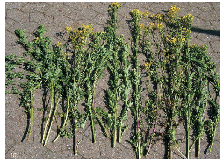
15 Triebe entsprechen 1000 g Frischmasse oder 150 g Trockenmasse

Die Gefahr ist erheblich, wenn man sich vor Augen führt, dass ein einzelner ausgewachsener Trieb im Mittel etwa 70 g Frischmasse oder 10 g Trockenmasse wiegt. Die auf dem Foto unten gezeigten 15 Triebe haben zusammen bereits ein Frischgewicht von 1000 g.