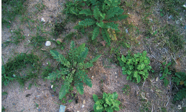
Blattformen im Rosettenstadium

Der Stängel ist an der Basis rötlich, ansonsten grün, kantig gerillt und teilweise spinnwebartig behaart. Die Stängellänge liegt zwischen 20 und 130 cm.