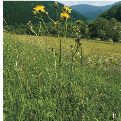
Wiesen-Pippau ( Crepis biennis )