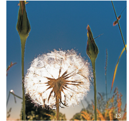
Wiesen-Bocksbart in der Samenreife