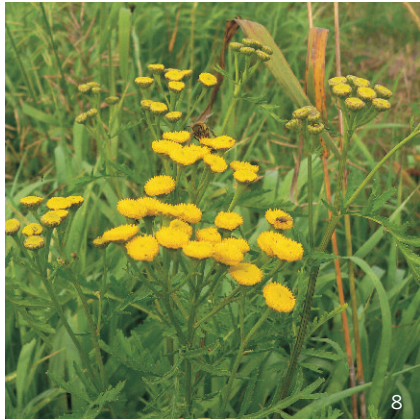
Rainfarn ( Tanacetum vulgare )